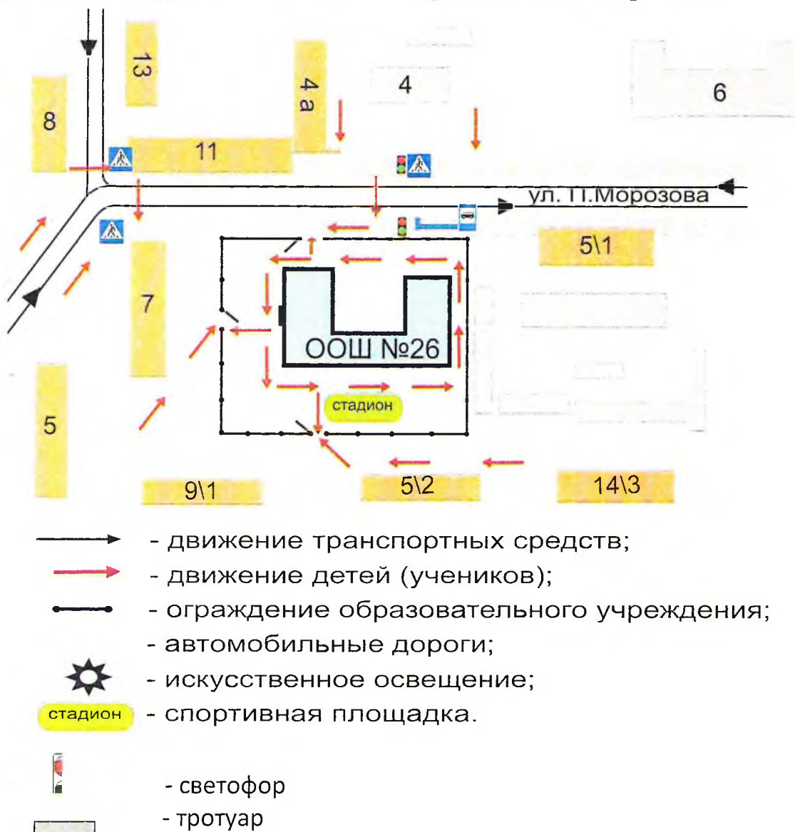
Схема организации дорожного движения в непосредственной близости от образовательного учреждения с размещением соответствующих технических средств, маршруты движения детей и расположение парковочных мест.