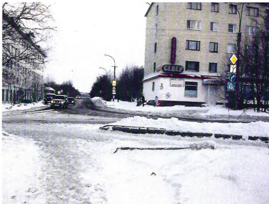
Регулируемый пешеходный переход перекресток ул. Гагарина и пр. Г.Североморцев